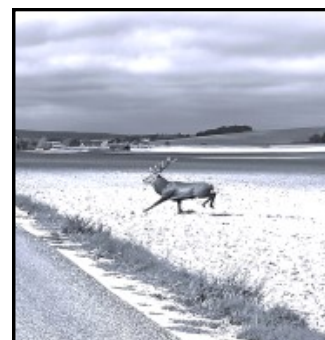
Une belle rencontre POUY-SUR-VANNE