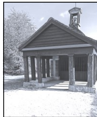
La chapelle Sainte Reine BERULLE

S OUS l'égide de la FFCT, le CODEP 10 cyclo organise chaque année un Rallye-Découverte « l'Aube à Vélo » ouvert à tout cycliste licencié ou non licencié. Ce Rallye-Découverte a pour objectif de faire découvrir les richesses touristiques du département de l'Aube à travers 24 circuits homologués que l'on retrouve sur le site Internet FFCT de « veloentrance ».