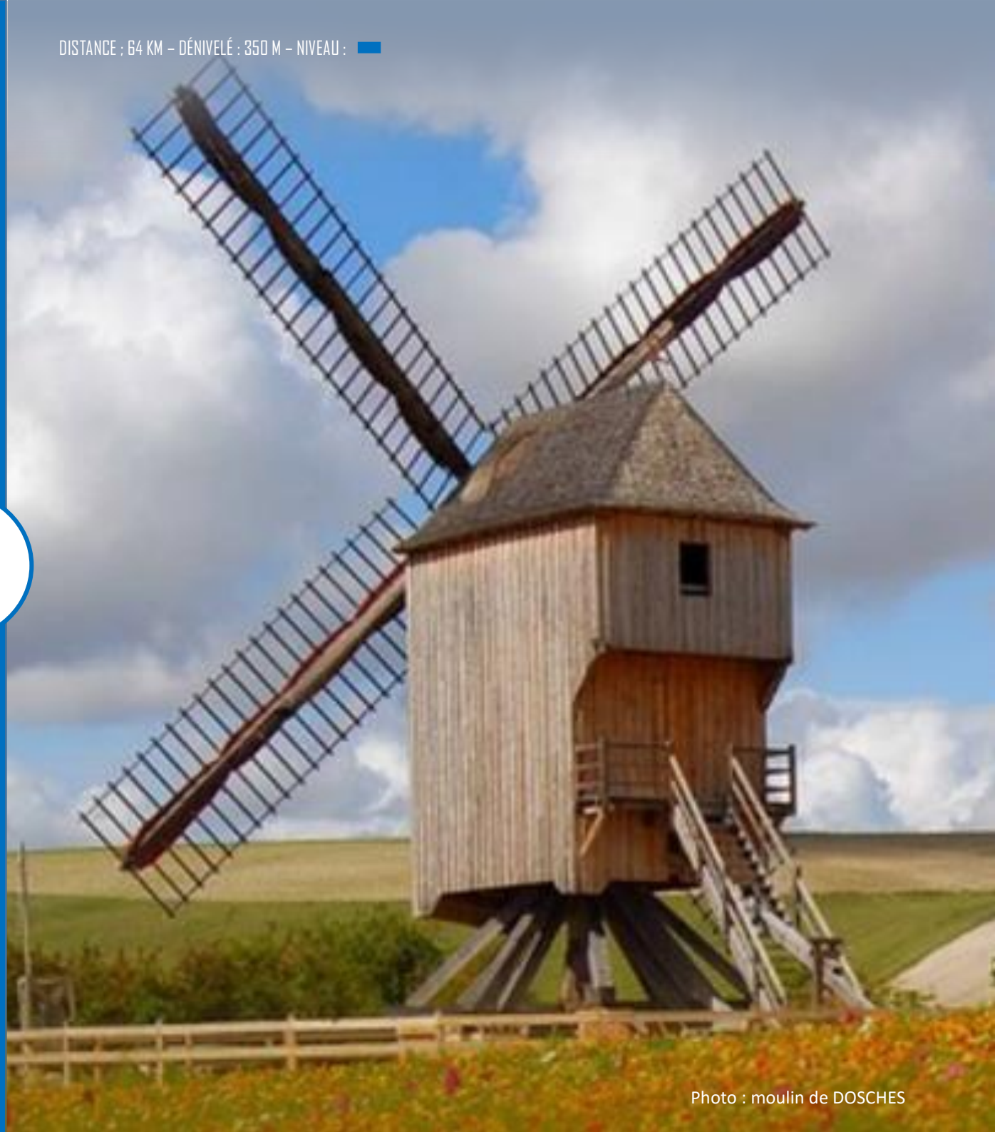
Photo : moulin de DOSCHES